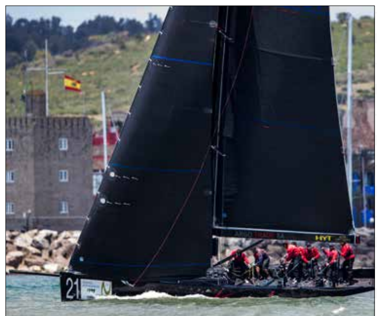
✓ International J/80 and RC44 competitions in Sotogrande