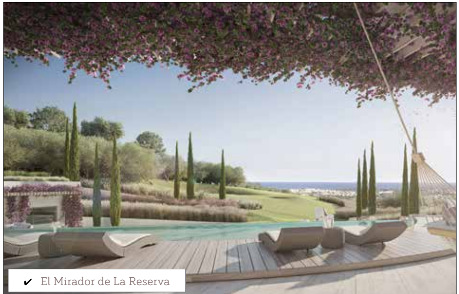
✓ El Mirador de La Reserva

Sergio García; the winner of the Valderrama Masters de Andalucía was followed by around 41,000 spectators. With a card of 4 under par (-12), Sergio García managed to beat the Dutch player Joost Luiten by one point in a tournament sponsored by the Re-