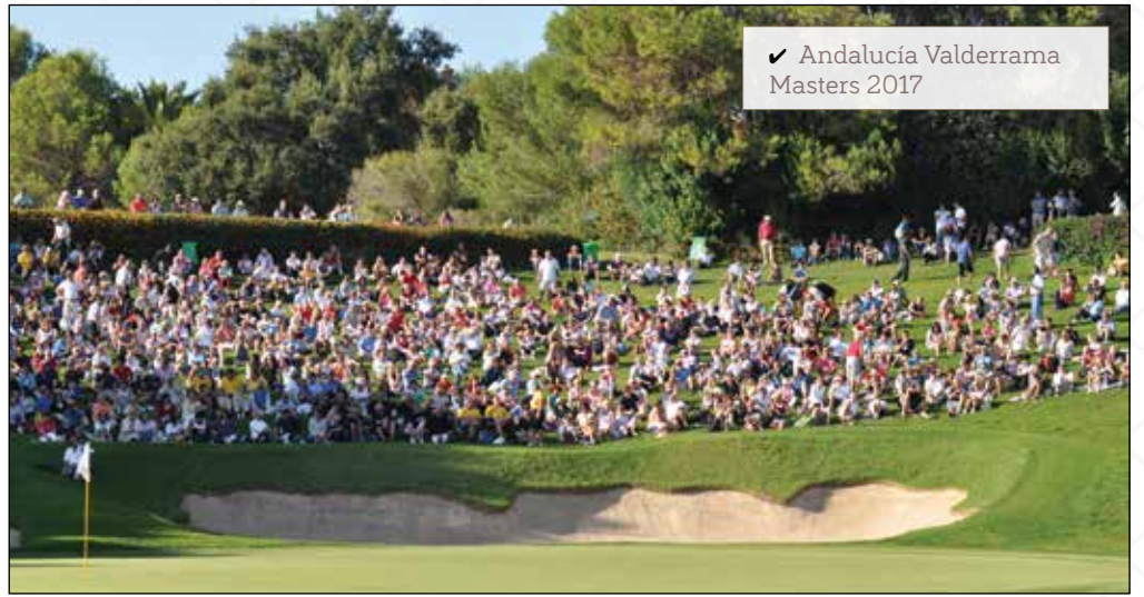
✓ Andalucía Valderrama Masters 2017