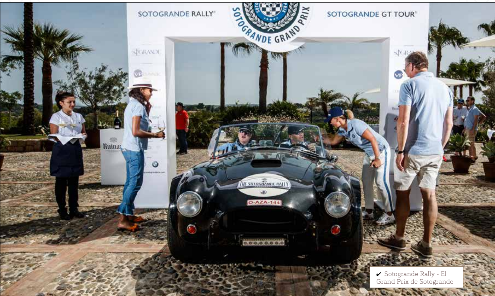
✓ Sotogrande Rally - El Grand Prix de Sotogrande