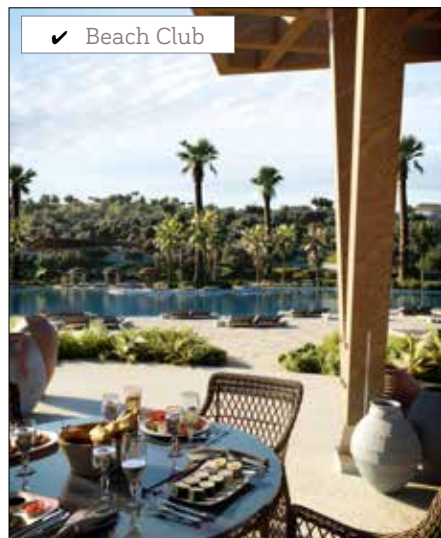
✓ Beach Club

The icing on the cake was the White Party at La Reserva, which took place on 9 August and which was the great event of the summer, that everyone talked about for weeks. The large number of guests had a great time, enjoying all kinds of gastronomic delights, live music, juggling acts, magic shows and DJ's who livened up the dance floor.