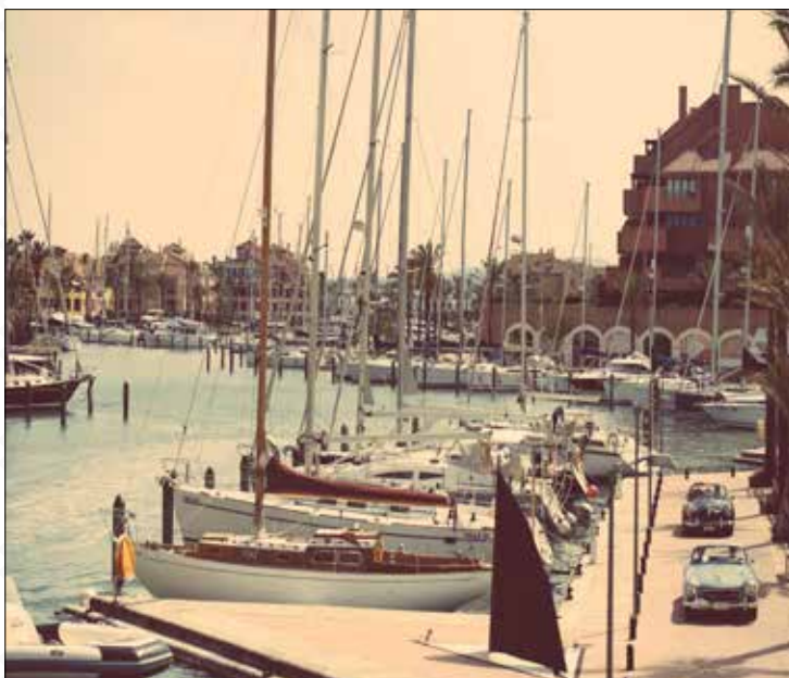
✓ Sotogrande Rally - Sotogrande Grand Prix