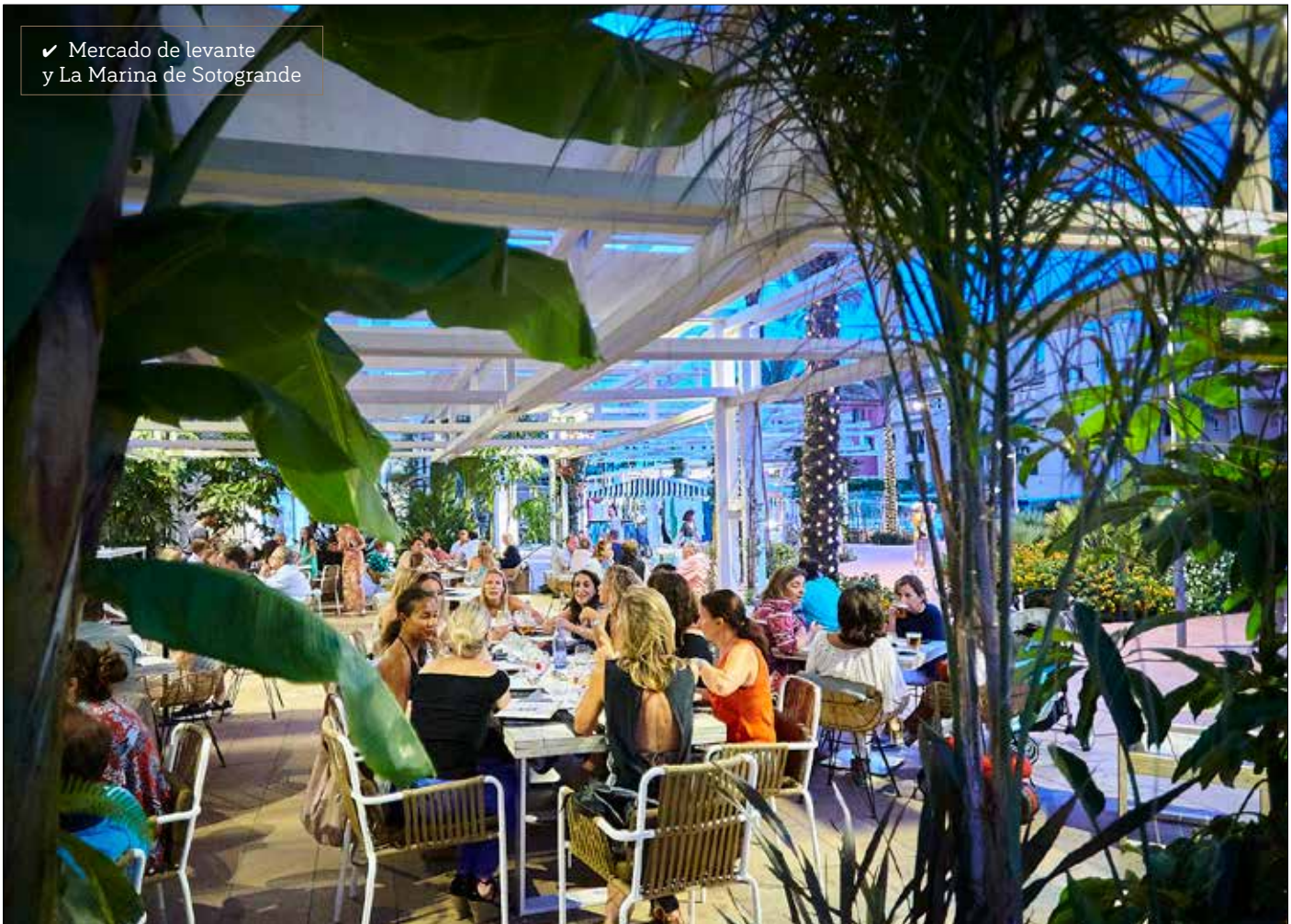
✓ Mercado de levante y La Marina de Sotogrande

Sergio García; El ganador de los Valderrama Masters de Andalucía fue seguido por alrededor de 41,000 espectadores. Con una tarjeta de 4 golpes bajo par (-12), Sergio García logró vencer al holandés Joost Luiten por un punto en un torneo patrocinado por la Junta de Andalucía y La Reser-