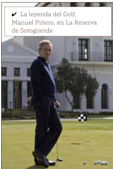
✓ La leyenda del Golf, Manuel Piñero, en La Reserva de Sotogrande

La guinda del pastel fue la Fiesta Blanca de La Reserva, que tuvo lugar el 9 de agosto y que fue el gran evento del verano, y del que todo el mundo habló durante semanas. Los numerosos invitados disfrutaron de todo tipo