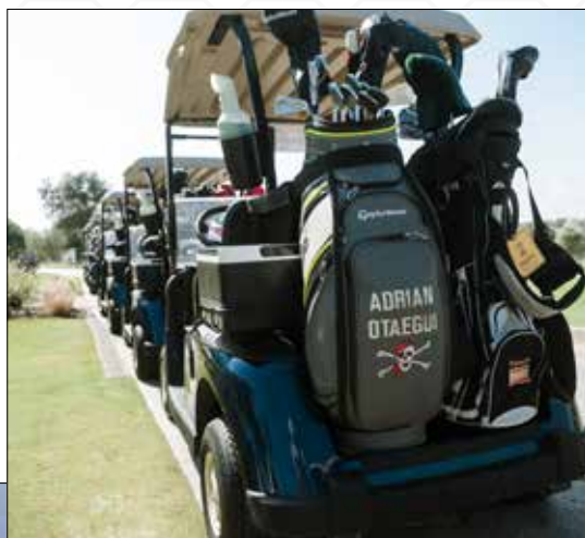
✓ El Mirador de La Reserva