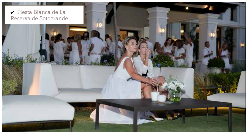
✓ Fiesta Blanca de La Reserva de Sotogrande